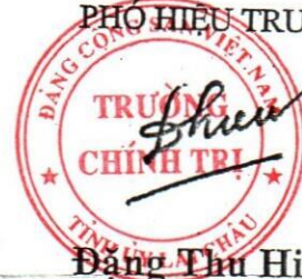
Đặng Thu Hiếu